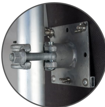
Au moyen de trois écrous, la fixation à l'échafaudage est installée en une fraction de seconde à la scie.