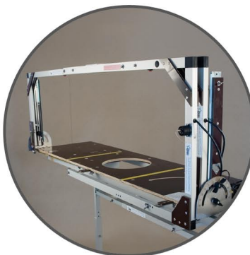
Scie L-G-S 135R y compris arc de coupe VH 135.