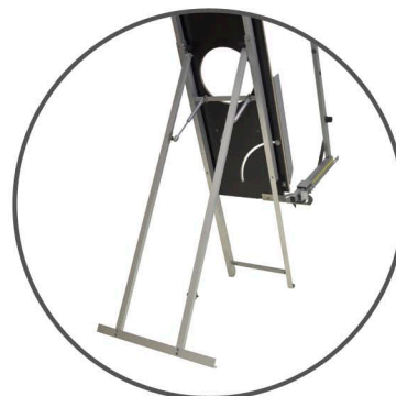
Das Schneidegeräte kann mit der Standvorrichtung fest verbunden werden.